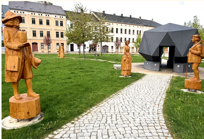
Foto Kassiteritkristalle: Von Alchemeist-hp (talk) (www.pse-mendelejew.de) - Eigenes Werk, GFDL 1.2, https://commons.wikimedia.org/w/index.php?curid=9645092