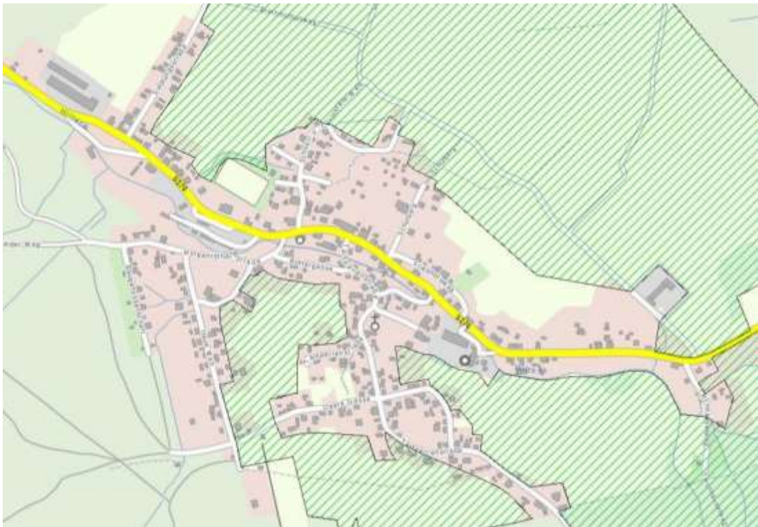
Abbildung 3: Ausschnitt FFH-Gebiet Erzgebirgskamm am Großen Kranichsee“ ( www.umwelt.sachsen.de )

Nach § 34 Abs. 1 BNatSchG sind Projekte vor ihrer Zulassung oder Durchführung auf ihre Verträglichkeit mit den Erhaltungszielen eines Natura 2000-Gebiets zu überprüfen, wenn sie einzeln oder im Zusammenwirken mit anderen Projekten und Plänen geeignet sind, das Gebiet erheblich zu beeinträchtigen. Eine FFH-Prognose durch die untere Naturschutzbehörde fand im Zuge der Trägerbeteiligung zum Vorentwurf der FNP-Änderung (Stellungnahme des Landratsamtes vom 05.11.2020) statt.