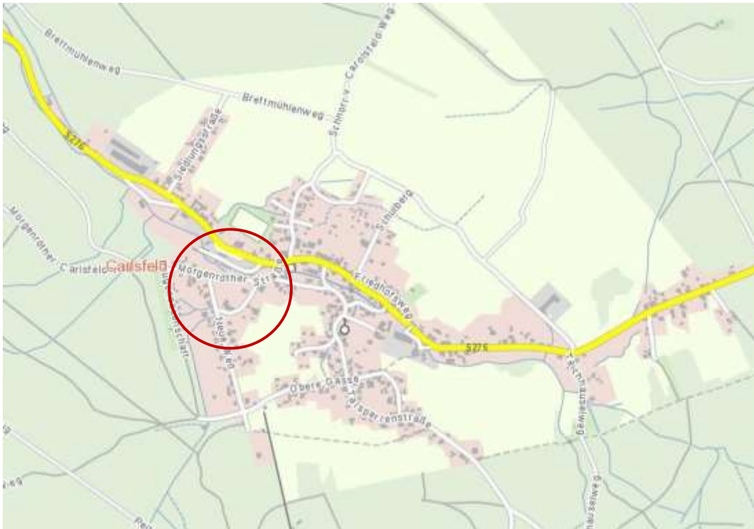
Abbildung 1: Lage im Raum, 8. Änderung FNP (Geoportal Sachsen)

Personenbeförderung - die Bahn wurde 1967 eingestellt und die Strecke zurückgebaut.