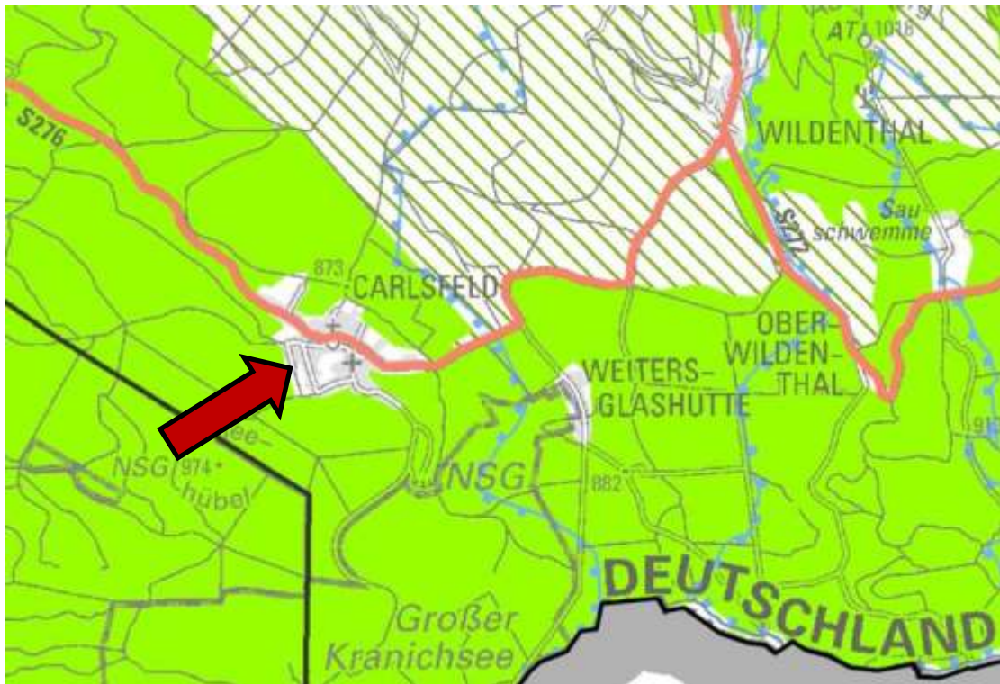
Abbildung 2: Auszug aus Karte 1.1 „Raumnutzung“ des Regionalplanentwurfes Region Chemnitz

Die Umnutzung der Fläche in Carlsfeld stellt eine Aufwertung des Istzustandes dar, so dass keine Bedenken in Bezug auf die Regionalplanung bestehen. Die Planung ermöglicht eine dem aktuellen Bedürfnissen angepassten Nutzung bereits beanspruchter Flächen. Mit der Aufstellung des Bebauungsplanes und der Flächennutzungsplanänderung kann die Gemeinde die Bauflächenentwicklung steuern.