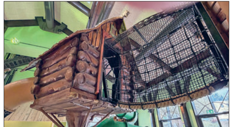
Die „Hühnerfuß-Hütte“ der Baba Jaga lädt zum Klettern ein.