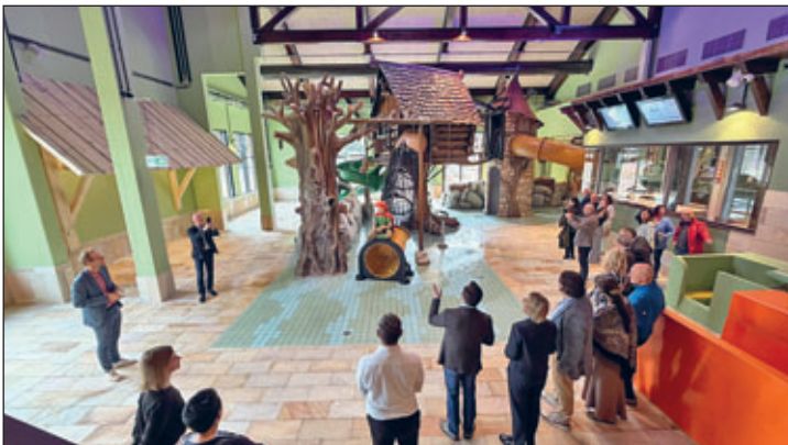
Das neue Herzstück der Anlage mit drei Rutschen greift das Thema der Saunalandschaft fantasievoll auf.