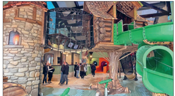
Vorsicht, Wasserkanonen! Im neuen Bereich gibt es viele Wasserspiele. Hier bleibt niemand trocken.