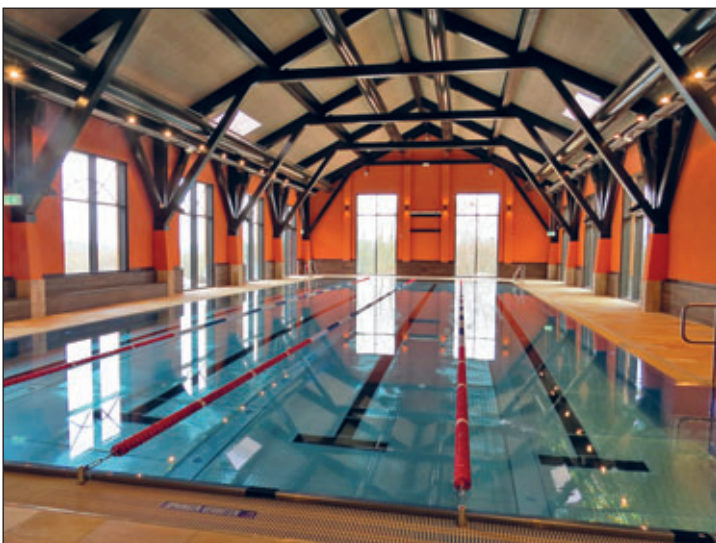
Wer möchte da nicht sofort hineinspringen? Der neue 25-Meter-Pool mit herrlicher Aussicht ist für sportliches Schwimmen ideal.