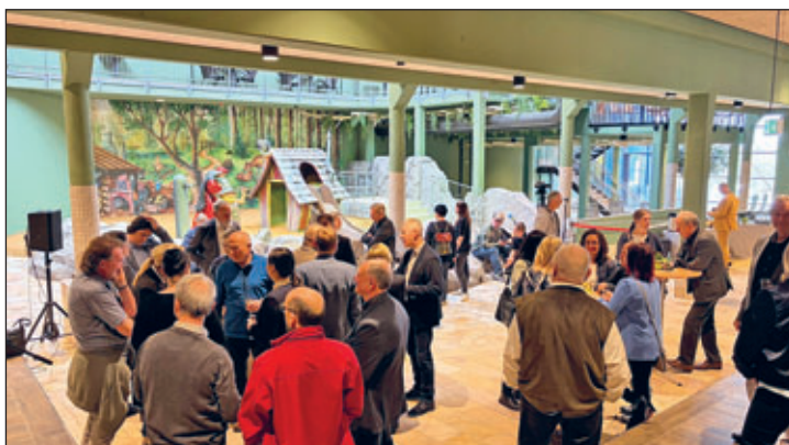
Zur Eröffnung versammelten sich zahlreiche Gäste im neu gestalteten Reich von „Quibi“ in den Badegärten.

Staatsministerin Klepsch, die selbst auch gern Familienurlaub mit ihren Enkelkindern macht, lobte die neuen Attraktionen und auch die Zielstrebigkeit, mit der in Eibenstock die touristischen Projekte vorange-